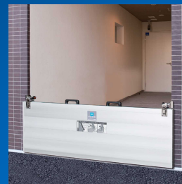
仕切りが無い開口部