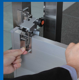
③パチン錠でセット