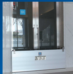
ドアのある開口部